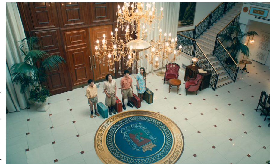
מתוך סדרת הטלוויזיה "כראמל". ברנע-גולדברג חולמת על עיבוד של דיסני